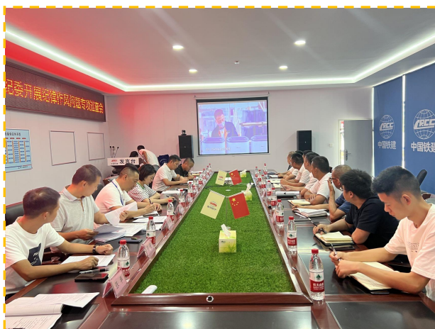
观看《安全生产月》警示教育片 通报工程建设领域腐败典型案例各3次

二是通过组织建设项目参建单位观看《安全生产月》警示教育片、通报工程建设领域腐败典型案例的形式，进一步督促相关人员履行工作职责、遵守法律法规、规范自身行为，坚决杜绝降低标准、“吃拿卡要”、勾结作假等违法违规行为。