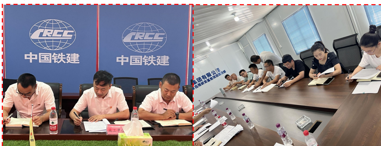
党风廉政建设开展情况汇报6次

三是通过组织开展专题座谈会，听取公司（项目）主要负责人落实党风廉政建设开展情况的汇报，对建设项目参建单位主要负责人开展廉政谈话后并签署廉洁承诺书等形式，进一步提醒相关单位及人员要始终保持清醒头脑，时刻紧绷廉洁自律之弦，守住廉洁从业底线；